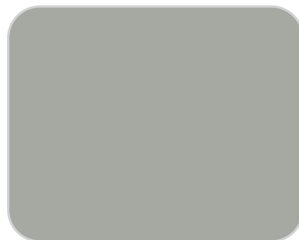
Gris Clair / Light Grey - CO 24