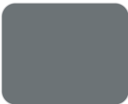
Gris / Grey - CO 17